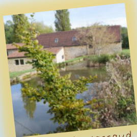
Moulin de Massaud