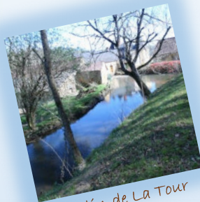
Moulin de La Tour