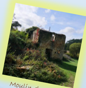
Moulin de Rigal