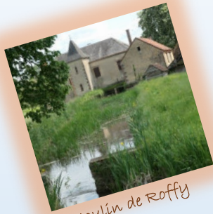
Moulin de Roffy